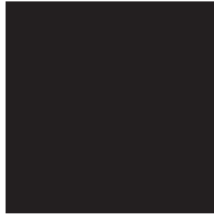
PT BLACK C