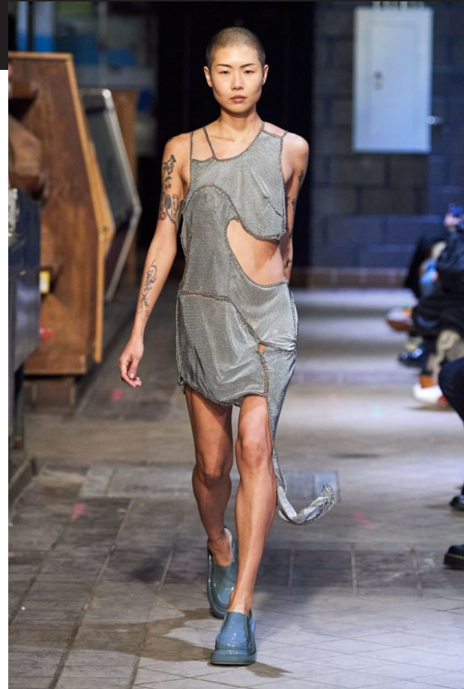
ECKHAUS LATTA, INVERNO 23