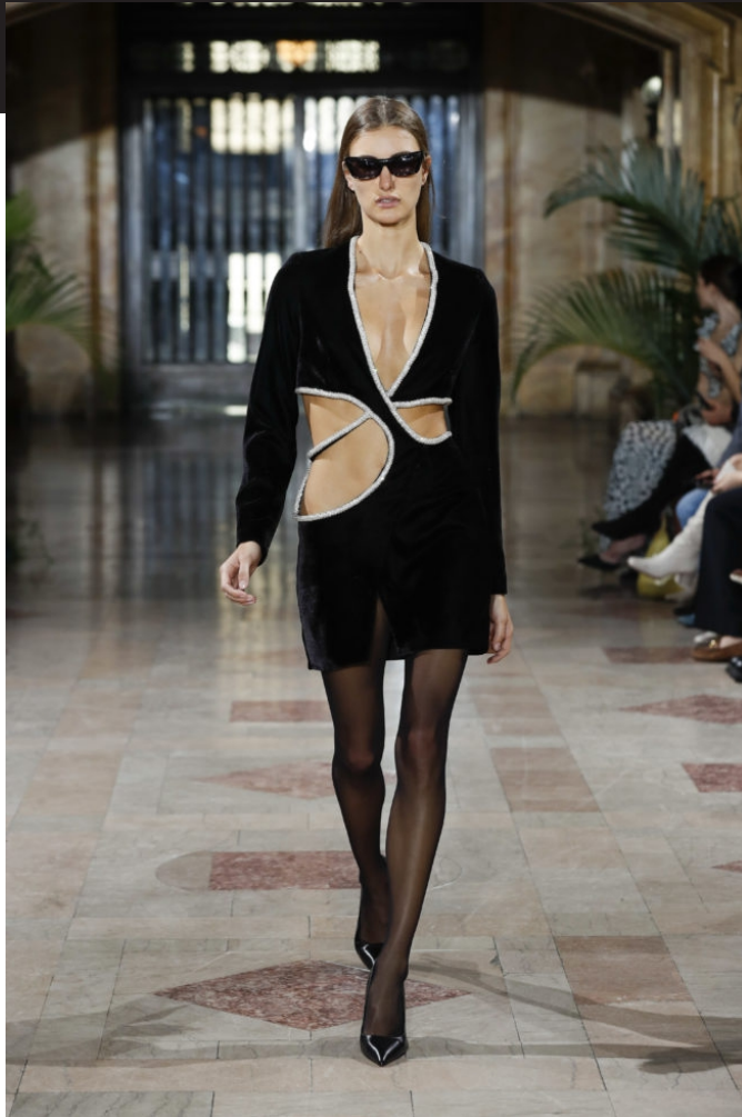
PATBO, INVERNO 23