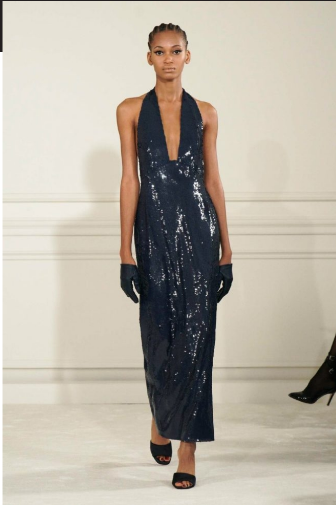
VALENTINO, VERÃO 22